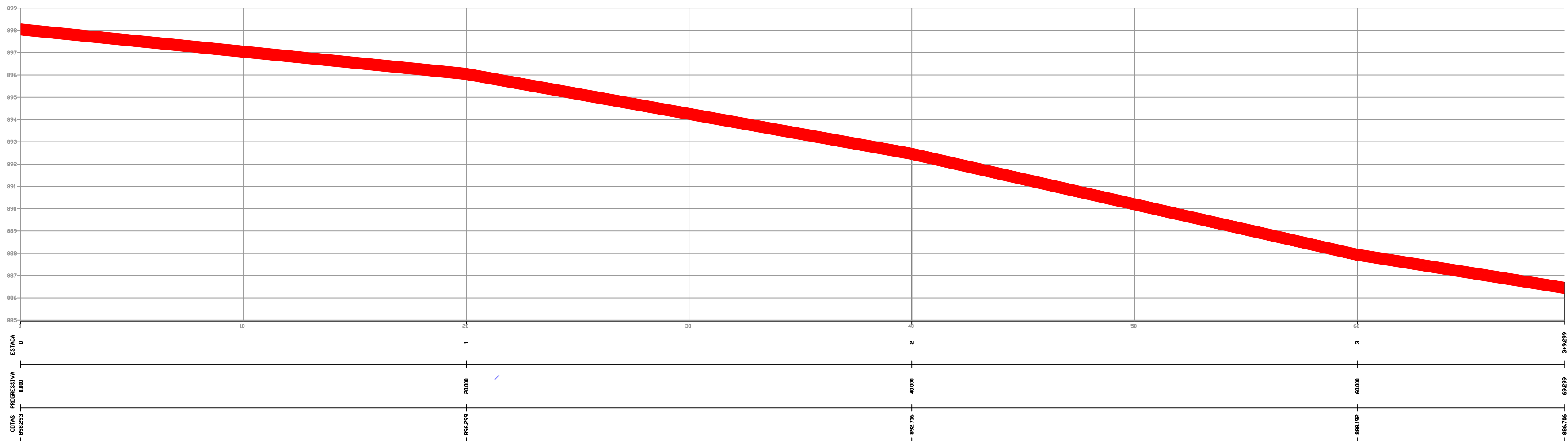
Perfil — Nicolau Menegasso